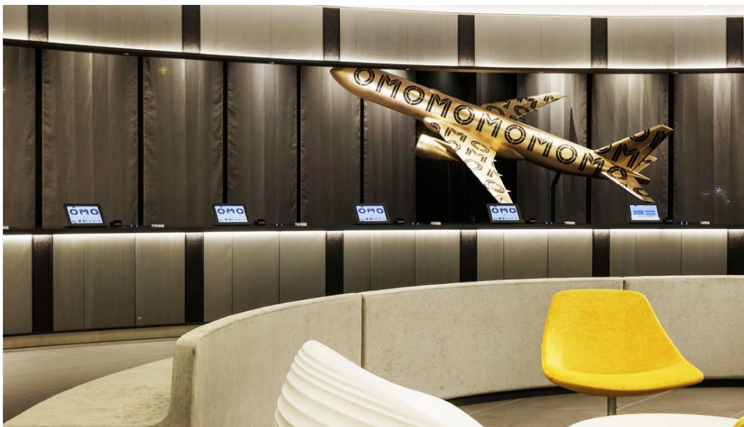
銅賞を受賞したOMO 関西空港 by 星野リゾートのサインデザイン

三井デザインテック株式会社（本社：東京都中央区、代表取締役社長：檜木田敦）は、第57回日本サインデザイン賞において、当社の手掛けたOMO 関西空港 by 星野リゾートのエアポートホテルサインデザイン計画が銅賞を受賞いたしましたので、お知らせいたします。また、当社は昨年も東京ドームサイン計画が入選しており、2年連続で応募作品が入選しています。11月30日には贈賞式も執り行われ、当社の関係社員が参加しました。